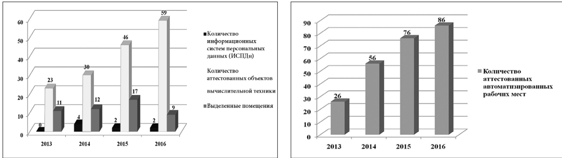
Рис. 1. Динамика роста количества аттестационных мероприятий

кументов), при этом количество объектов информатизации, подлежащих аттестации, ежегодно увеличивается.