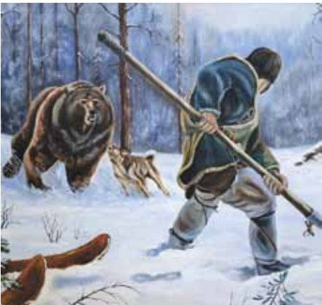
В УФСИН России по Кировской области подвели итоги смотра-конкурса изделий художественно-прикладного творчества осужденных.

Подготовка к конкурсу заняла несколько месяцев, предоставив умельцам возможность довести свои работы до совершенства. Условия состязания не были строгими, все ограничивалось оригинальностью решений и фантазией самих участников.