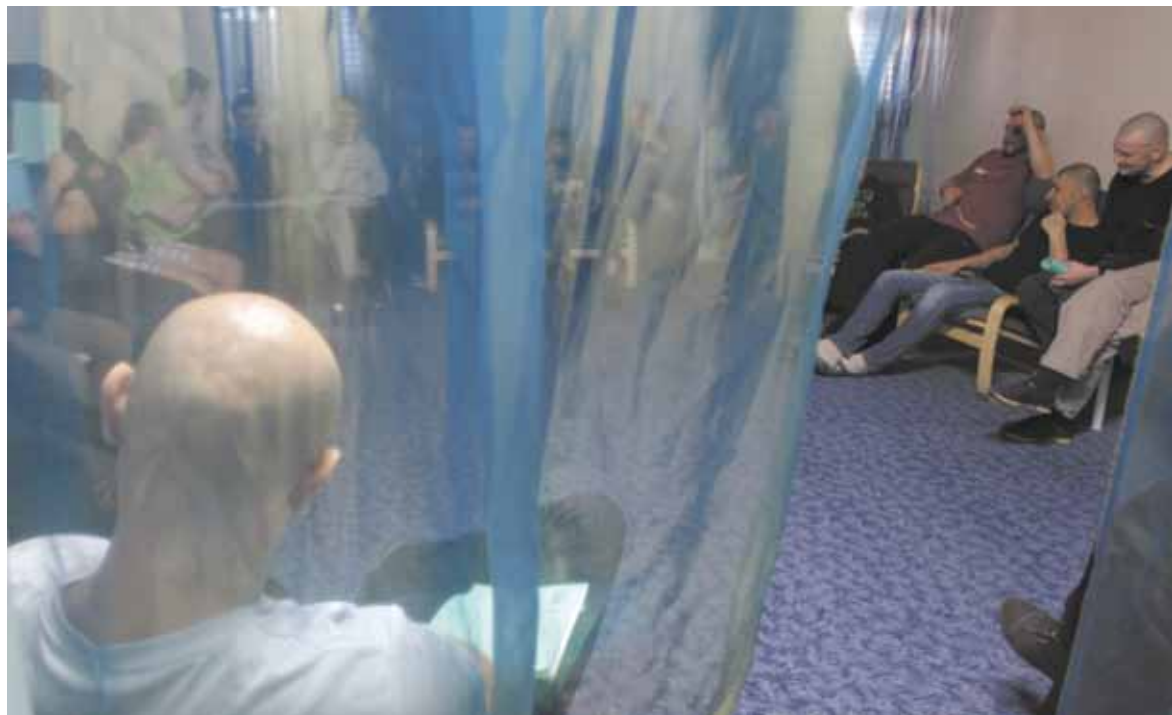
В комнате психологической разгрузки