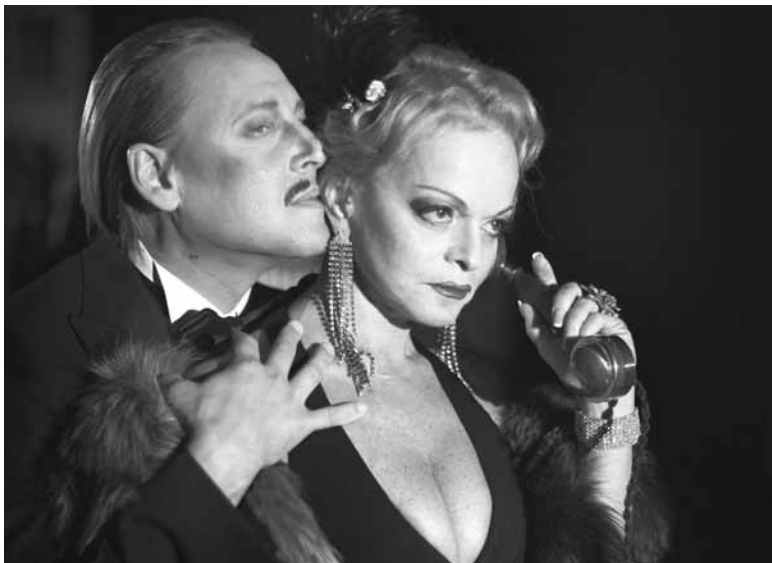
Лариса Долина и Дмитрий Харатьян в мюзикле «Любовь и шпионаж»