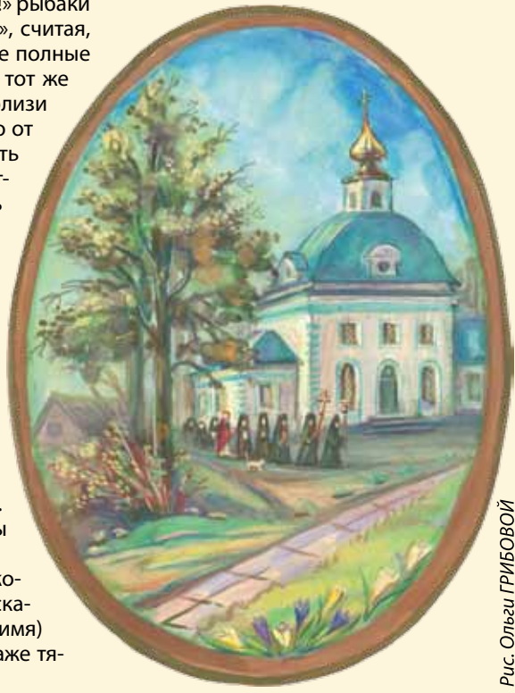
Рис. Ольга ГРИБОВОЙ

Народные приметы на Пасху имеют и исцеляющие свойства. Например, если ребенок часто болел, нужно было пасхальным, освященным яйцом окрестить его трижды, и затем малыш должен был скушать это яйцо.